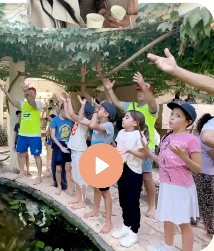
תמיכה בקיבוץ עלומים בשיתוף ISLF, נובמבר 2023