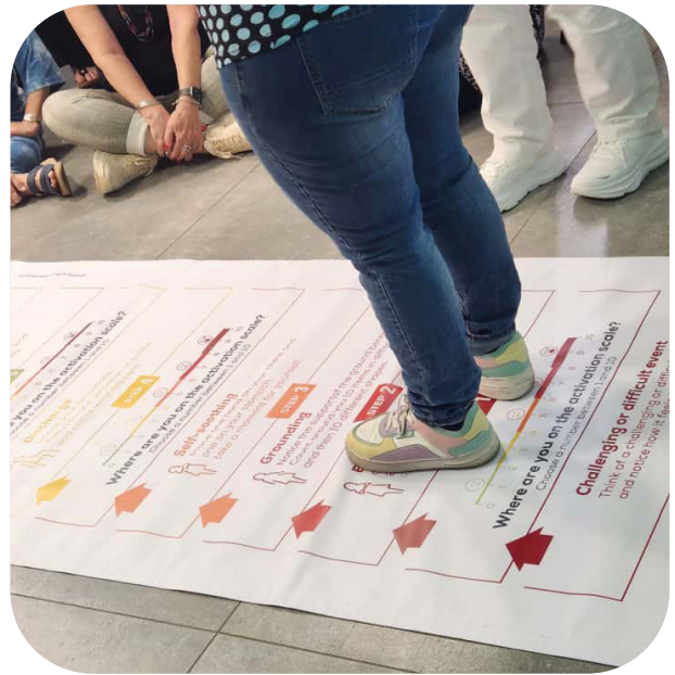
Eric Cohen Books workshop, Nov 25